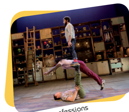
Cuisine et confessions

Pour découvrir l'ensemble des spectacles proposés, nous vous invitons à parcourir le site internet de Cholet et son agglomération, à l'adresse suivante : http://www.cholet.fr/welcome/theatre_saint_louis.php