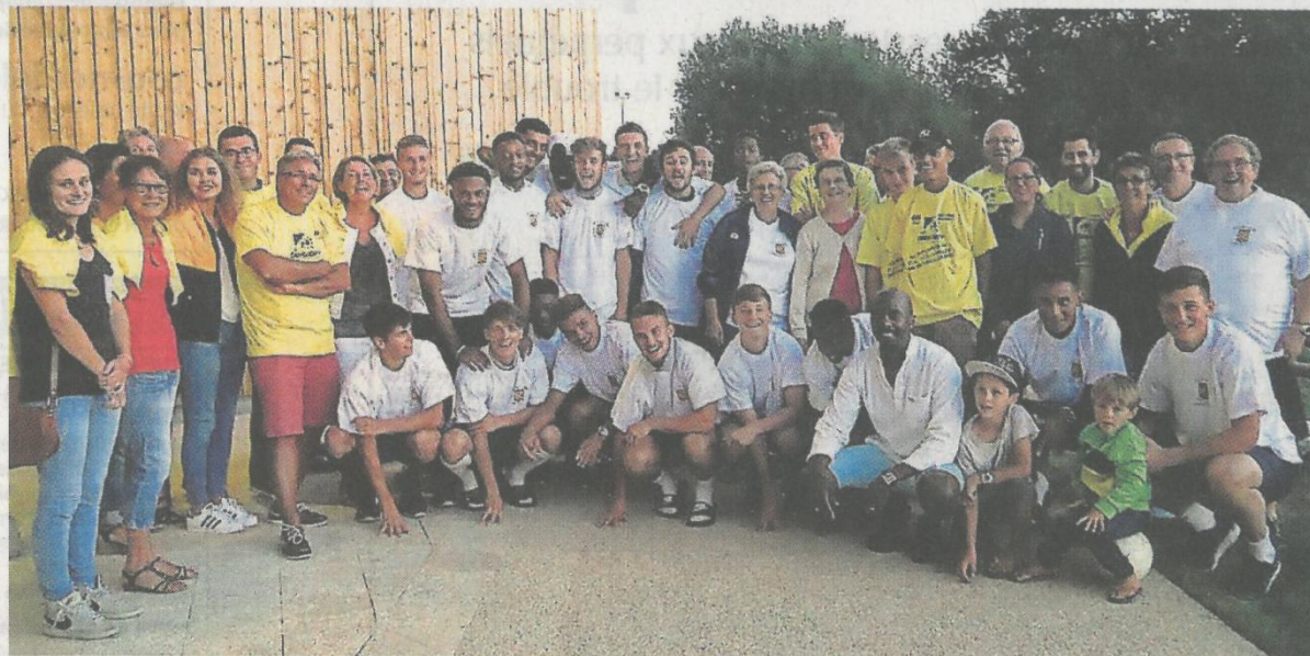
Les Jeunes Sochaliens en compagnie des onze familles d'accueil, jeudi lors de leur arrivée.

Onze familles de la commune accueillent les 18 joueurs U 19 du FC Sochaux, leur dirigeant et le coach, depuis jeudi dans le cadre du tournoi Carisport.