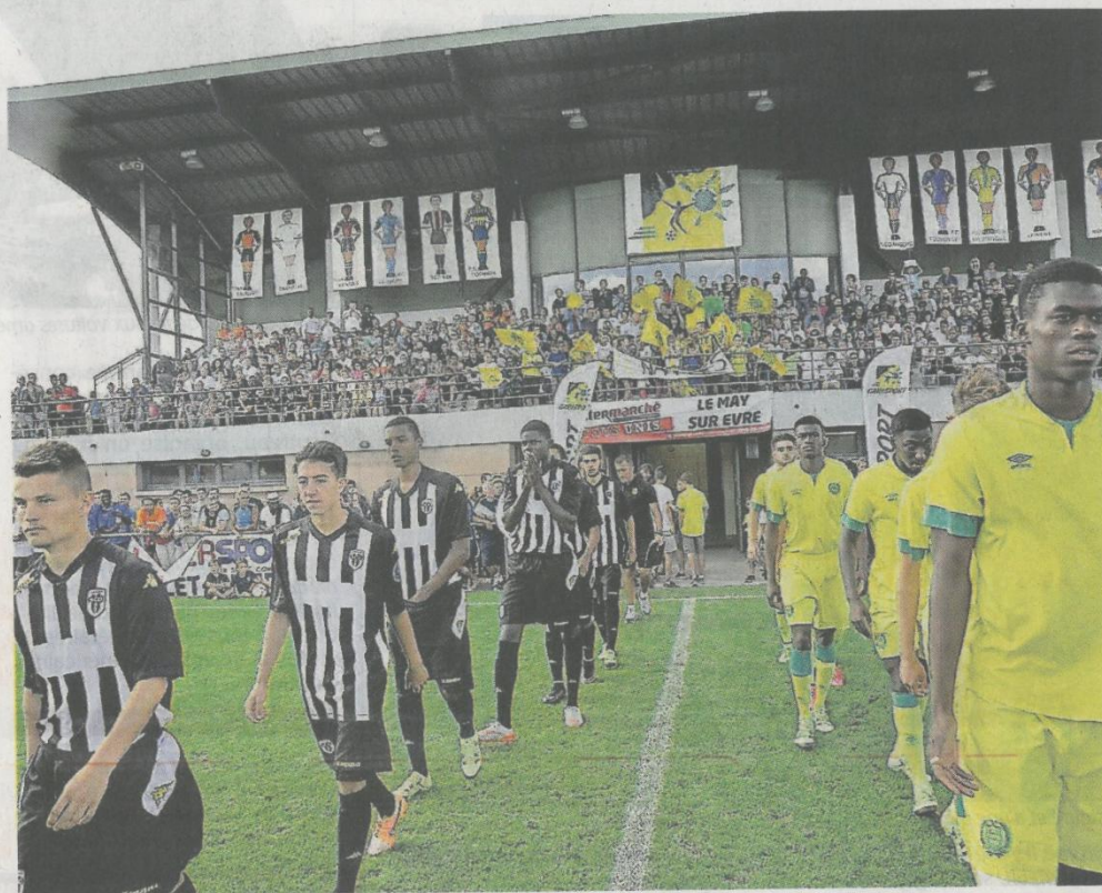
Comme l'an dernier, les équipes du FC Nantes et d'Angers SCO seront présentes à Carisport.