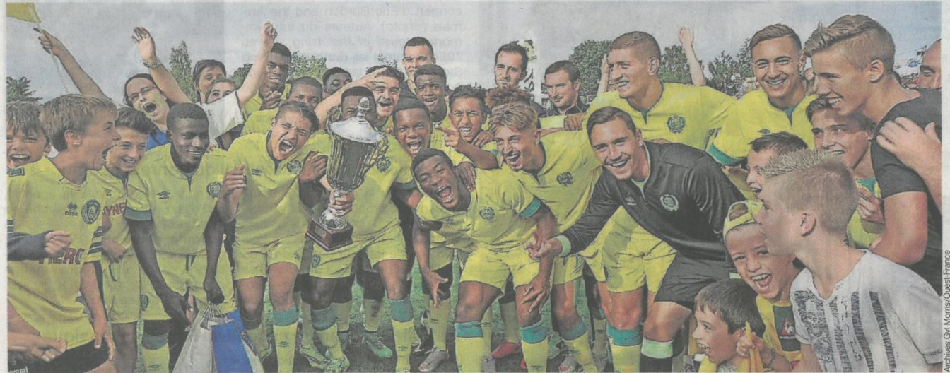
Une douzaine d'équipes s'affrontent pour tenter de remporter le tournoi (gagné ici par le FC Nantes en 2015).

Le tournoi caritatif débute ce samedi au May-sur-Èvre, La Jubaudière, Bégrolles-en-Mauges et Saint-Léger-sous-Cholet. Une importante compétition pour les jeunes footballeurs.