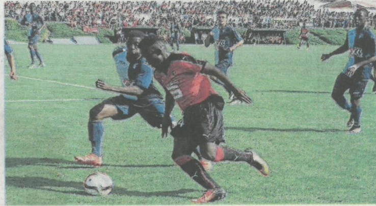
Après les matches de poules samedi, la finale de l'édition 2016 de Carisport a opposé Le Havre et Rennes, dimanche après-midi, au May-sur-Èvre.

Le tournoi de football caritatif Carisport s'est terminé hier. L'association dresse un bilan positif de cette édition 2016.