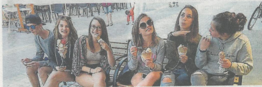
Pause glace pour un groupe de Saint-Léger lors d'une sortie à la mer.

Les animations vacances proposées par le centre social intercommunal ocsigène (CSI) ont ponctué l'été de 123 jeunes des communes de Saint-Léger, La Séguinière, La Romagne, Saint-Christophe, Bégrolles durant le mois de juillet.