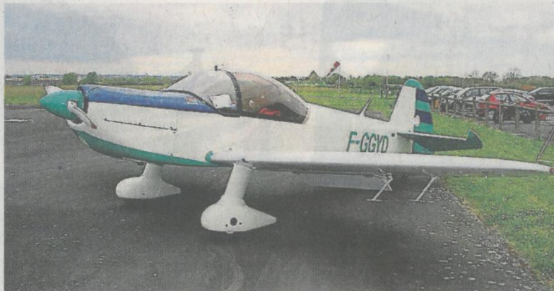
Le fameux Cap 10 utilisé par une vingtaine de pilotes pour la voltige.

Dans ce courrier, il relève cette phrase : « A ce jour, les outils mis à notre disposition (...) ne nous permettent pas de modéliser le bruit engendré par cette activité. » Un logiciel