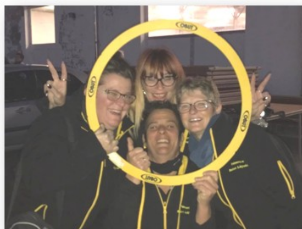
Au plaisir de partager de bons moments.

Enfin, le prix de l'inscription est de 40 € pour les Saint Légeois.