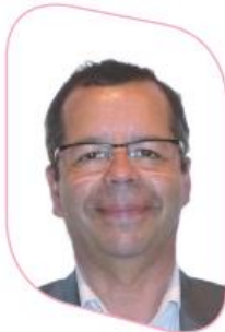
Permanence Vie Associative