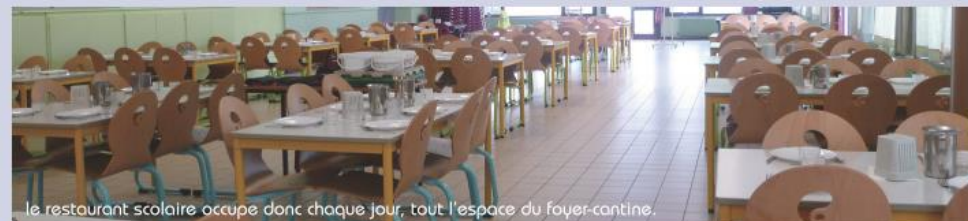
le restaurant scolaire occupe donc chaque jour, tout l'espace du foyer-cantine.

Une progression importante, car la moyenne des présences était de 217 en cours d'année scolaire 2013-2014.