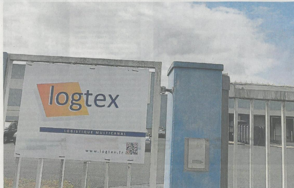
Cholet, rue de Blois, hier. L'entreprise est pour l'instant cachée dans une zone industrielle très peu exposée entre deux géants économiques locaux.

La société de logistique textile, qui a déjà un site à Cholet, devrait occuper la plateforme de 25 000 m 2 dont la construction doit débuter à l'automne dans la zone du Cormier V.