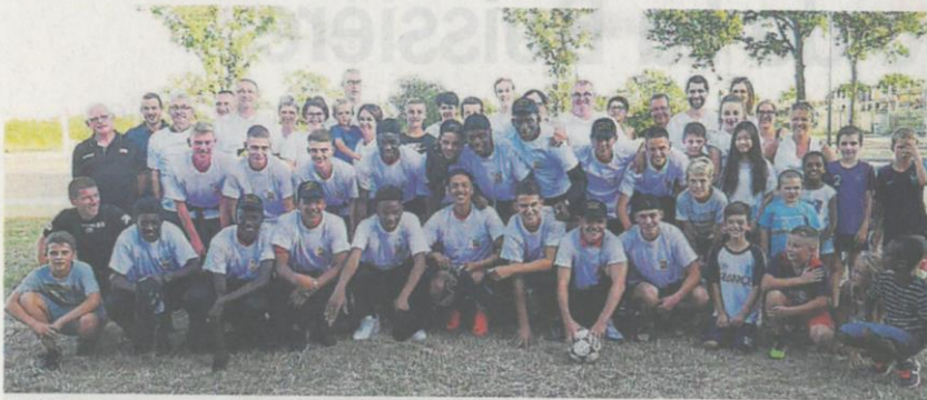
Jeudi, les joueurs, leurs encadrants et les familles ont été reçus par la municipalité.