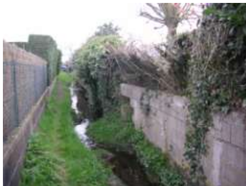
Mur des deux premiers terrains construit au milieu du lit

Importante arrivée d'eau sous le premier terrain