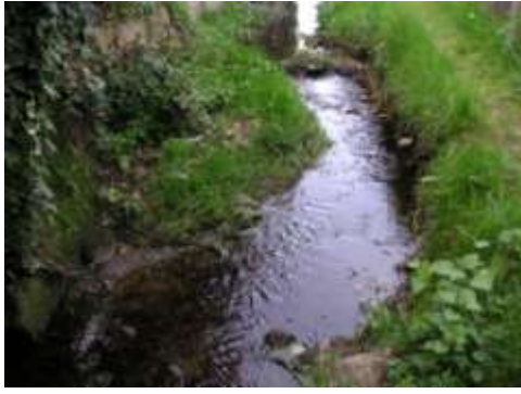
Légère déviation du ruisseau en face l'arrivée d'eau