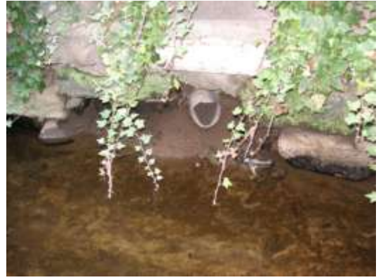
Autre arrivée d'eau