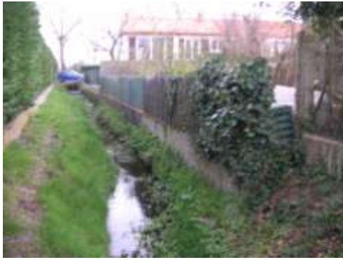
5ème terrain : clôture en bon état, en bordure du ruisseau