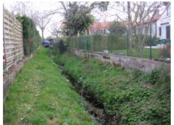
3ème et 4ème terrain : clôture en bon état, en retrait de 1.50 m