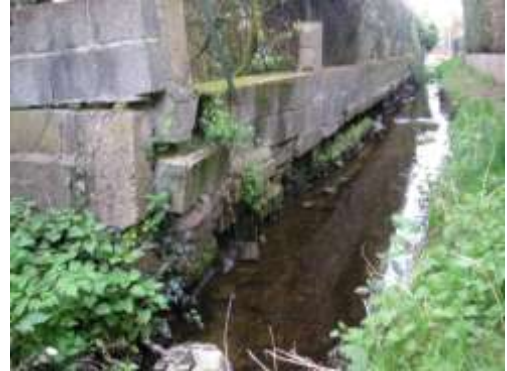
Situation critique !