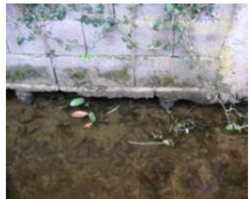
Base du mur dégradée