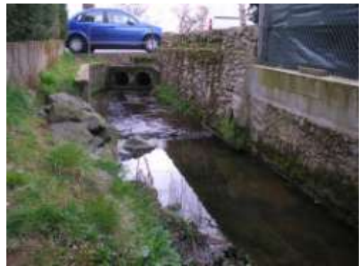
6ème terrain : clôture « mur » en bon état, en bordure du ruisseau

M. POTIRON présente ensuite le schéma de l'existant et l'étude réalisée par la Commission Développement Durable :