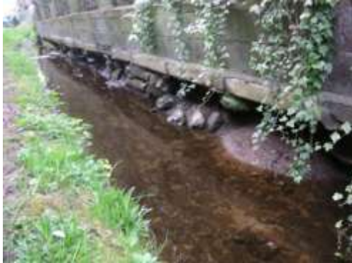
2ème terrain : mur prêt à s'effondrer