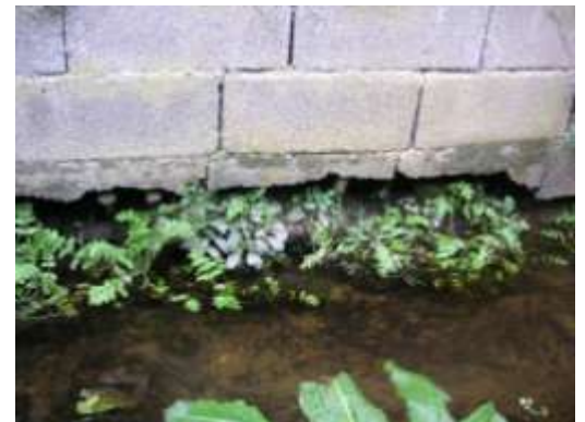
Base du mur dégradée