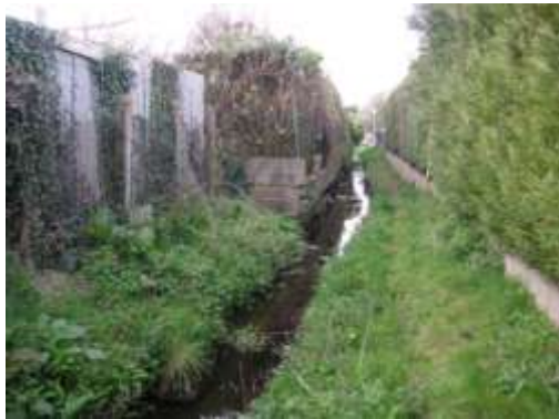
←→ Espace privé