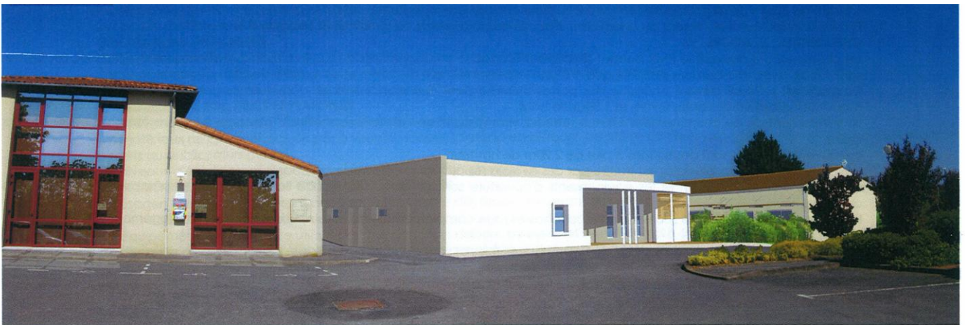
Le pôle culturel et le foyer d'animation

Muriel sera ravie de mettre en œuvre des propositions nouvelles et d'accueillir des nouveaux venus.