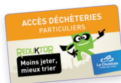
Carte de déchèterie