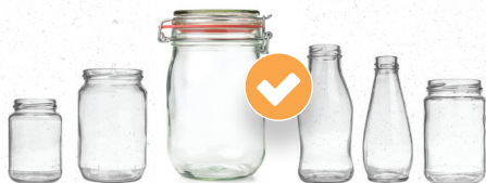
Les bocaux, les pots, les flacons