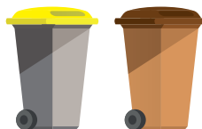
Obtenir, échanger ou même réparer vos bacs