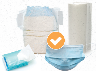
Les produits à usage unique et non recyclables Masques chirurgicaux, sacs aspirateur, essuie-tout, mouchoirs, couches, coton...

Ou les points d'apport volontaire dédiés aux ordures ménagères