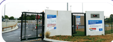
Horaires d'ouverture des déchèteries