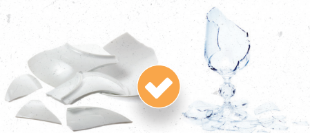
La vaisselle et le verre cassés