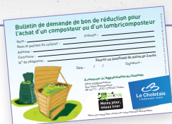
Bulletin de demande de bon de réduction pour composteur et lombricomposteur