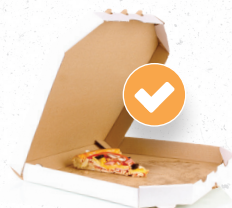
Les emballages souillés Boîtes à pizza avec restes alimentaires...