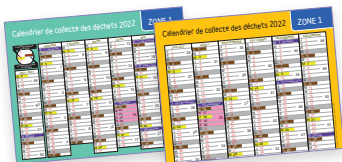
Calendrier de collecte

Je trouve les principales informations utiles sur le site cholet.fr , rubrique environnement.