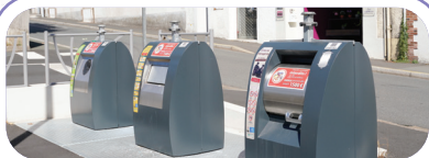
Emplacement + des points d'apport volontaire + des éco-points et déchèteries