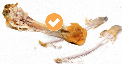
Les résidus alimentaires Viandes, poissons...